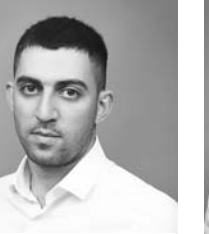
БИБИЛОВ Аслан Автондилович